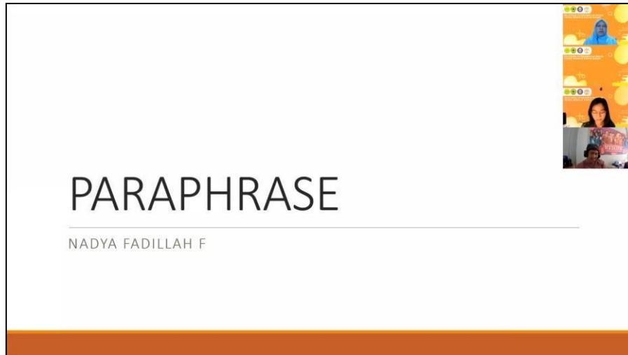
Gambar 3b. Penyampaian materi parafrase

Kemudian dilanjutkan materi tentang Grammarly dan Ms Office Advance dan terakhir dengan materi Akses jurnal internasional dan Publikasi internasional. Semua materi yang disampaikan sangat bermanfaat dan relevan dengan kebutuhan para dosen dan mahasiswa yang mengikuti kegiatan ini dalam melakukan penelitian karya ilmiah. Penyampaian materi berlangsung selama kurang lebih 30-60 menit. Selama acara berlangsung, kegiatan terselenggara dengan interaktif dan antusiasme peserta yang terdiri dari dosen dan mahasiswa tingkat akhir. Kegiatan ini diakhiri dengan penutupan, peserta mengisi link evaluasi pelatihan yang dibagikan oleh panitia.