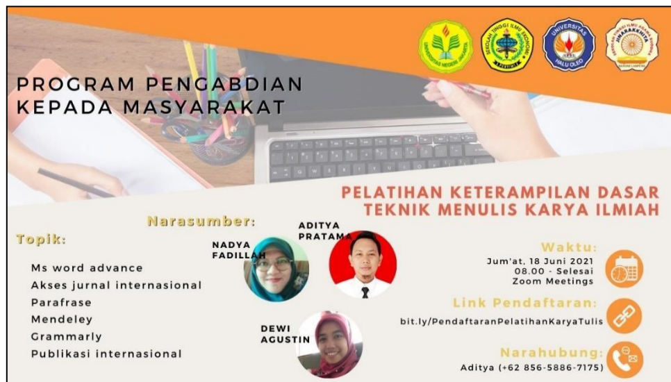
Gambar 1. eflyer kegiatan pelatihan keterampilan dasar dalam menulis karya ilmiah

menulis karya ilmiah sehingga penyelenggaraan materi pelatihan dapat saling melengkapi.