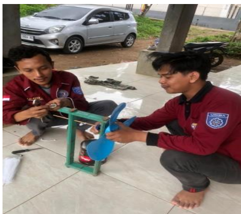
Gambar 8. Pembuat Alat Pengusir Burung

Hambatan dalam bidang ini ialah kurangnya pemahaman masyarakat mengenai pengetahuan tentang teknologi serta terbatasnya jaringan internet.