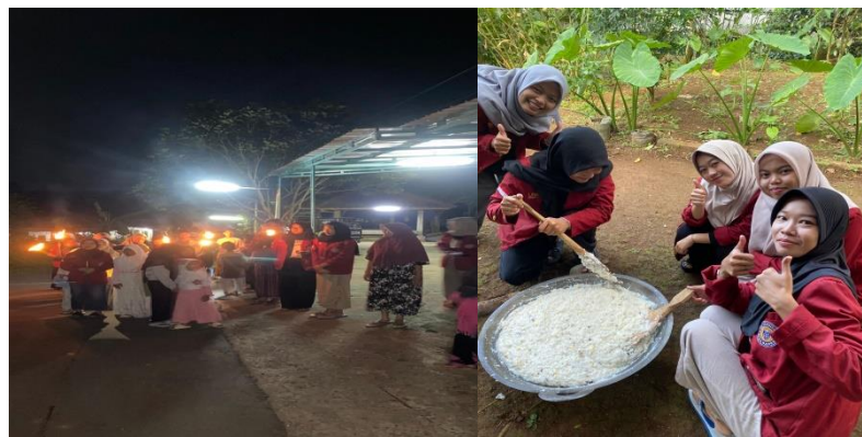
Gambar 3. Kegiatan pawai obor dan kegiatan memperingati 10 muharam