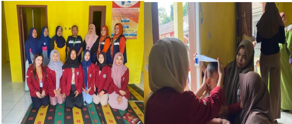
Gambar 6. Kegiatan Polio dan Posyandu

Kurangnya layanan kesehatan pada masyarakat yang ada di Desa Kurung Kambing. Sehingga, bisa dapat mengakibatkan terhambatnya sebuah pengetahuan serta pemahaman tentang pola gizi yang dapat seimbang. Namun, pada tanggal 06 Agustus 2024 terdapat pelayanan posyandu yang dihadiri mulai dari Ibu Hamil, Ibu menyusui, bayi, dan anak balita. Upaya Penanggulangannya yang dilakukan yaitu: (a) Menginformasikan terkait pelayanan kesehatan untuk masyarakat ke kantor desa. (b) Diadakannya posyandu setiap sebulan sekali, dan (c) Menindaklanjuti permasalahan kesehatan kepada pihak Kader desa.