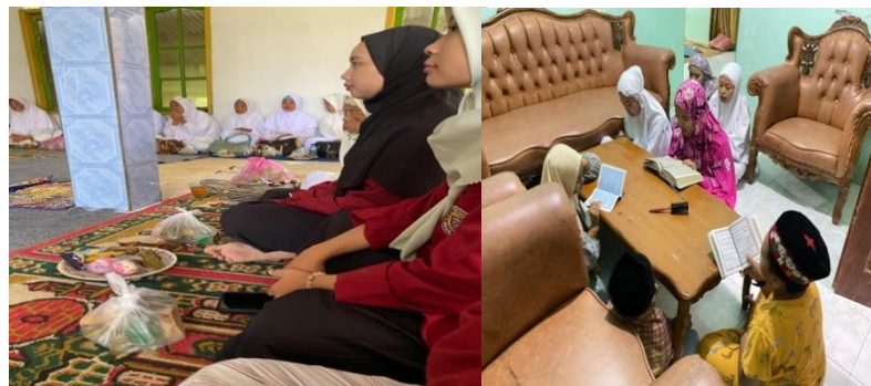
Gambar 4. Pengajian rutin dan mengajar ngaji anak-anak diposko