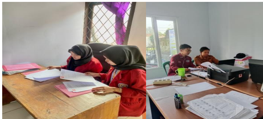
Gambar 7. Kegiatan Pendataan Siswa dan Penduduk