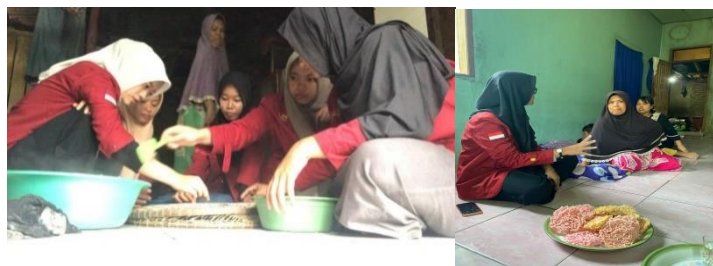
Gambar 2. Kegiatan membuat rengginang dan wawancara pelaku UMKM

Faktor yang mendorong kami untuk membina usaha UMKM, ini bisa dapat dianalisis dan dilihat ialah di segi potensi yang dimiliki oleh pelaku UMKM yang ada di Desa Kurung Kambing, khususnya di bidang usaha mikro kecil menengah ini sangat berpotensi sangat besar untuk dikembangkan karna dari segi sumber daya alam yang sudah tersedia.