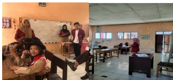
Gambar 1. Kegiatan Belajar Mengajar (KBM) di SDN Kurung Kambing 3

Setelah kami menyiapkan materi yang akan disampaikan ke pada anak-anak. Kami memikirkan bagaimana bentuk cara penyampaianya terumuslah belajar sambil bermain terutama pada kelas dua, tiga dan empat. Dengan memberikan materi yang diselingi dengan permainan akan memberikan motivasi dan semangat untuk anak-anak, sehingga mereka tidak akan merasa jenuh selama kegiatan belajar mengajar berlangsung.